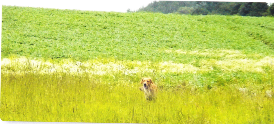
Het aardappelveld keldert voor velen de hoop op een finale plaats.

Voor dit onderdeel hadden de keurmeesters een open terrein van vele honderden meters lengte uitgekozen. De begroeiing bestond er uit maaigras van 40 centimeter hoog met op het einde ervan een opglooiend veld met aardappelen. Er werd telkens een walkup georganiseerd waarbij de honden voor de lijn een schot met opgeworpen dummy kregen. De eerste hond diende die gemarkeerde dummy zo snel mogelijk en op commando binnen te brengen. Daarna werd de walkup verder gezet waarbij achter de lijn een schot viel. De tweede hond diende zich te keren en werd uitgestuurd naar het andere einde van het grasveld waar het terrein overging in een gigantisch aardappelveld. Hierin was een ovaalvormig gebied begroeid met planten in bloei. Wellicht een gebiedje waarin hele sterke geuren werden afscheiden door de planten. Uiteraard werden de dummy's net hier verstoppt. Voor de jongste honden was er vooraf een marking geweest van de dummy's terwijl er vanaf novice verondersteld werd dat men de honden op een blind apport kon inzetten. Bij initiatie overleefden alle honden deze proef.