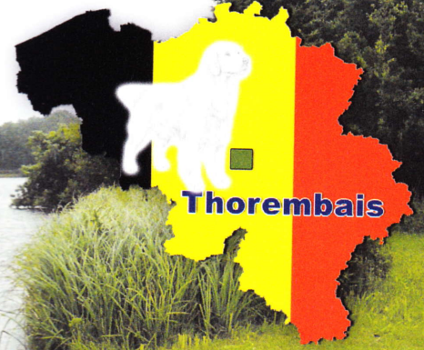
De grote vijver van Thorembais.